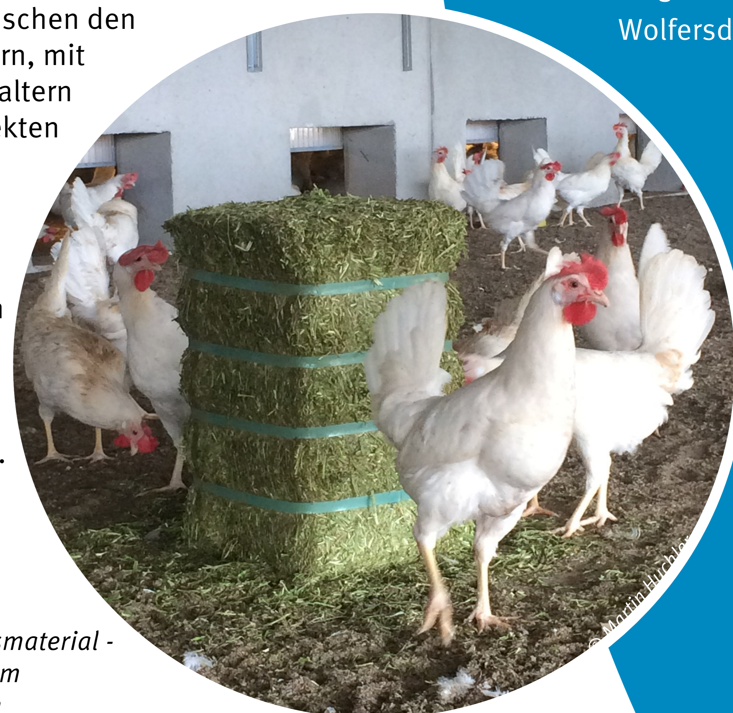
Abbildung 2: Beschäftigungsmaterial - Luzerneballen im Kaltscharrraum

und die Entwicklung eines zielgerichteten Beratungskonzeptes ermöglichen. Neben individuellen, zielgerichteten Beratungen Thüringer Legehennenhalter sind Erfahrungsaustausch und Wissenstransfer zwischen den Kooperationspartnern, mit Thüringer Geflügelhaltern und ähnlichen Projekten in anderen Bundesländern wichtige Komponenten von MeTiWoLT, um die gewonnenen Erkenntnisse effektiv und nachhaltig in der Praxis zu etablieren.