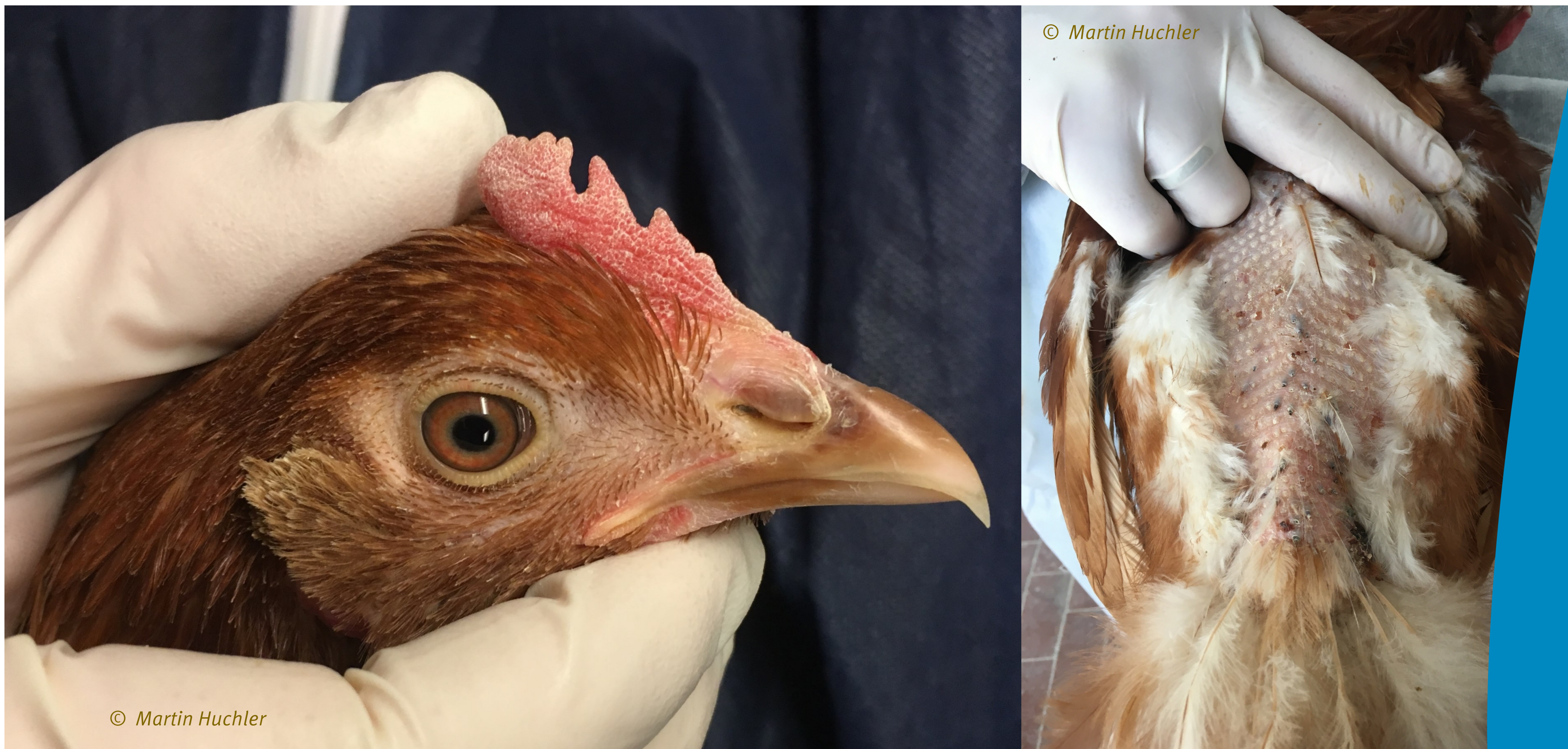
Abbildung 1: Huhn mit ungekürzter Schnabelspitze bzw. mit spitzem Schnabel (links), Gefiederschäden und Pickverletzungen am Rücken einer Legehenne (rechts)

Das Projekt MeTiWoLT unterstützt die Thüringer Legehennenhalter im Umgang mit diesen Herden durch die Entwicklung und Etablierung eines anwendungsorientierten Beratungs- und Managementkonzeptes.